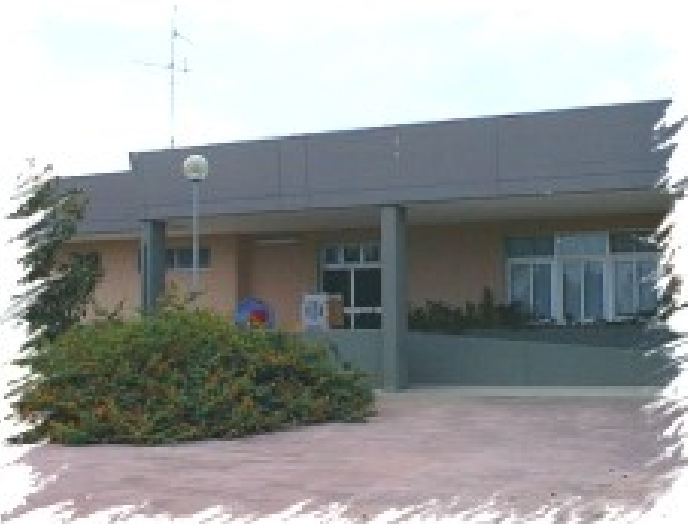
Plesso Walt Disney