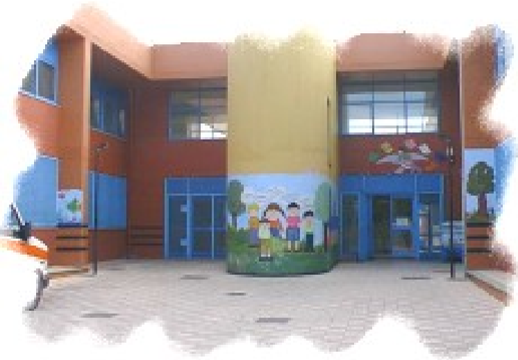
Presso Maria Maddalena