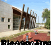
Classo R. Fumilla