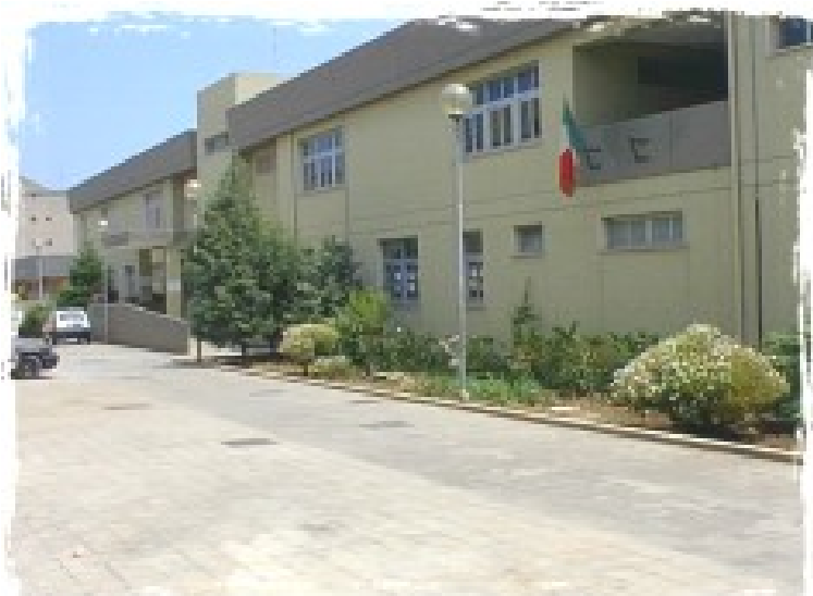
Successo Plesso Domenico Vacca