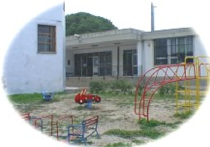
Plesso Arcobaleno ( GOOGLE MAPS )