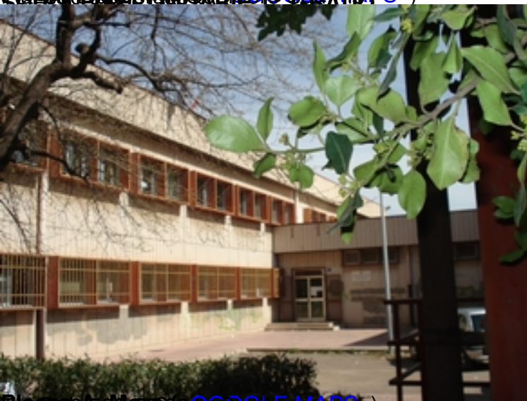
Presso Padre Saverio Spillo ( GOOGLE MAPS )