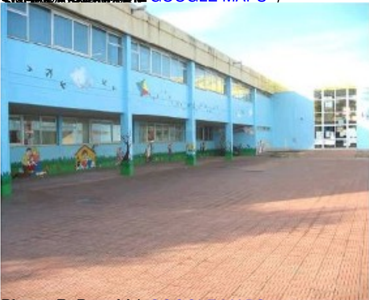
Classo R. Bonchi (GOOGLE MAPS) Via S. Agostino 10, 00187 Roma, Italia | Tel. 06/533.29.39 (Direzione Didattica)